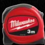
SLIM 3 M 48227703