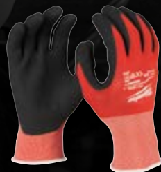
POZIOM OCHRONY 1

W ZAKRESIE ODPORNOŚCI NA ŚCIERANIE, PRZECIĘCIE, ROZDARCIE I PRZEKŁUCIE