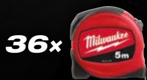
SLIM 5 M 48227705

OFERTY PRZEDSTAWIONE W TEJ ULOTCE NIE ŁĄCZĄ SIĘ ZE SOBĄ. PRZY SKŁADANIU ZAMÓWIENIA PROSIMY WYBRAĆ OFERTĘ, Z KTÓREJ PRAGNĄ PAŃSTWO SKORZYSTAĆ.