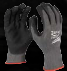
POZIOM OCHRONY 5

PRZYKŁADOWE ZASTOSOWANIA: ZDEJMOWANIE IZOLACJI, GWINTOWANIE RUR