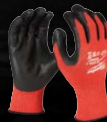
POZIOM OCHRONY 3

PRZYKŁADOWE ZASTOSOWANIA: PRACA W MAGAZYNIE, PRZENOSZENIE TOWARÓW, OTWIERANIE KARTONÓW